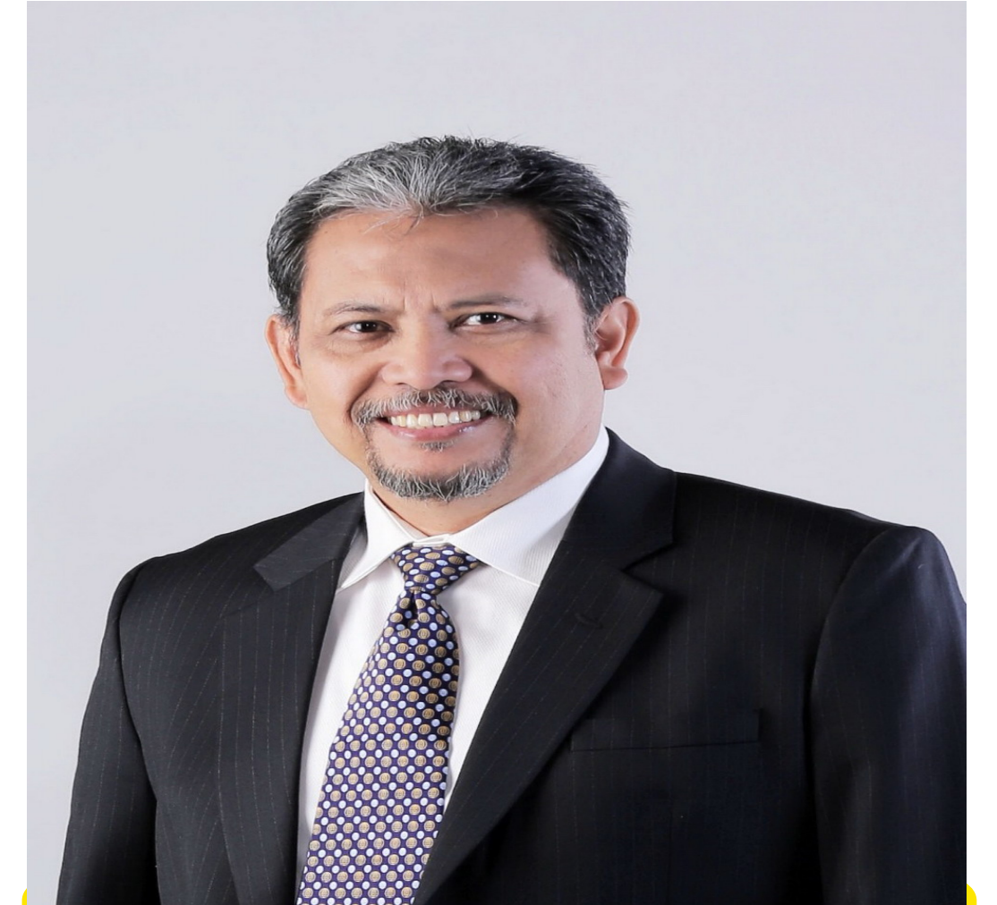
Wakil Dekan Bidang Administrasi dan Keuangan