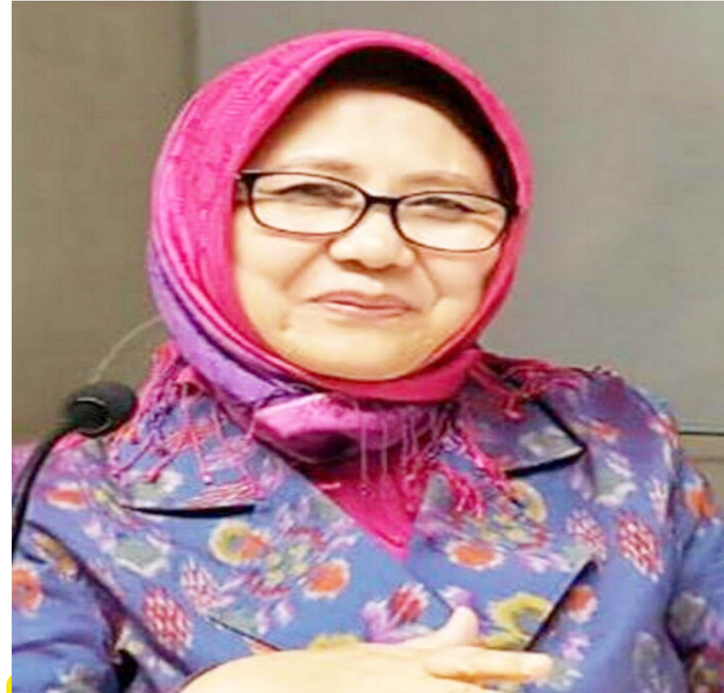
Wakil Dekan Bidang Akademik dan Kemahasiswaan